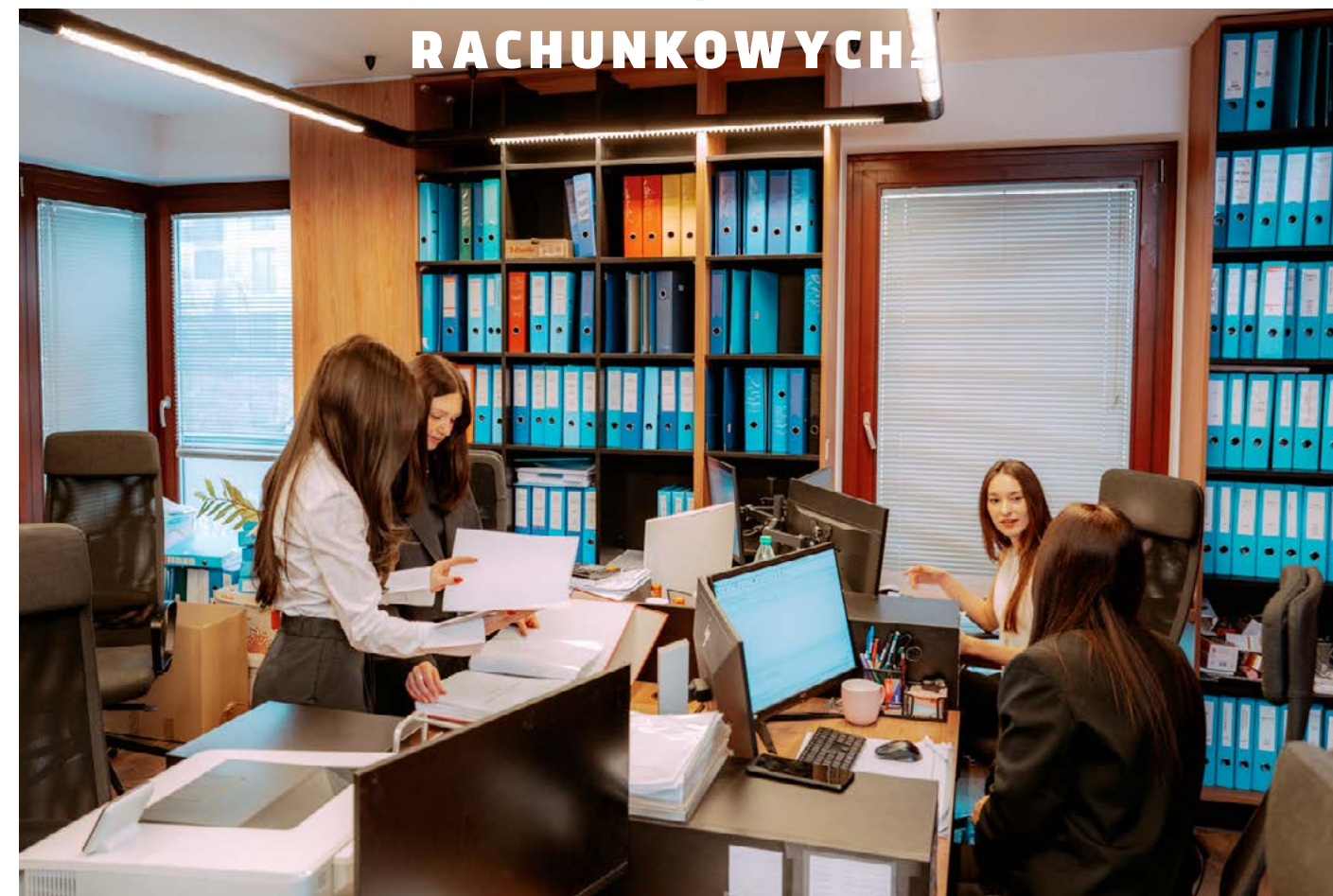
TEKST MAT. PRAS.

Rola księgowego w ostatnich latach ulega fundamentalnej zmianie. Współczesne biuro rachunkowe to już nie tylko miejsce ewidencjonowania dokumentów, ale centrum analityczne i doradcze, które aktywnie wspiera przedsiębiorców w podejmowaniu decyzji biznesowych. Automatyzacja procesów, sztuczna inteligencja, zaawansowana analiza danych oraz praca w chmurze stały się standardem, który realnie wpływa na jakość i tempo obsługi firm. W tym modelu księgowy łączy kompetencje finansowe z technologicznymi, potrafiąc korzystać z nowoczesnych systemów i narzędzi cyfrowych, które eliminują powtarzalne czynności i ograniczają ryzyko błędów. Jednym z kluczowych filarów nowoczesnej księgowości jest pełna digitalizacja. Elektroniczne faktu-