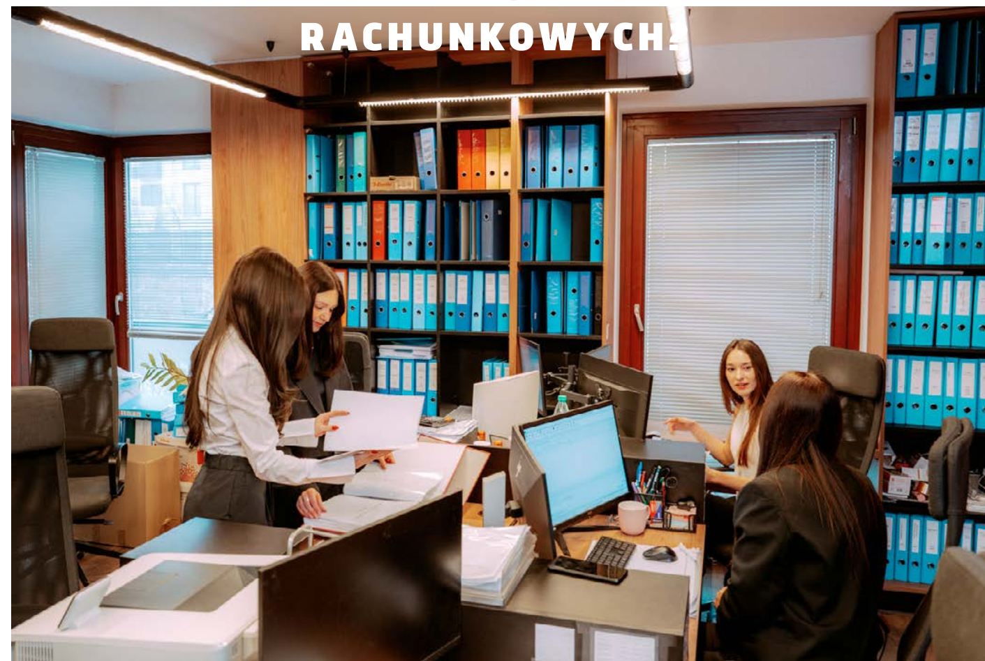
TEKST MAT. PRAS.

Rola księgowego w ostatnich latach ulega fundamentalnej zmianie. Współczesne biuro rachunkowe to już nie tylko miejsce ewidencjonowania dokumentów, ale centrum analityczne i doradcze, które aktywnie wspiera przedsiębiorców w podejmowaniu decyzji biznesowych. Automatyzacja procesów, sztuczna inteligencja, zaawansowana analiza danych oraz praca w chmurze stały się standardem, który realnie wpływa na jakość i tempo obsługi firm. W tym modelu księgowy łączy kompetencje finansowe z technologicznymi, potrafiąc korzystać z nowoczesnych systemów i narzędzi cyfrowych, które eliminują powtarzalne czynności i ograniczają ryzyko błędów. Jednym z kluczowych filarów nowoczesnej księgowości jest pełna digitalizacja. Elektroniczne faktu-