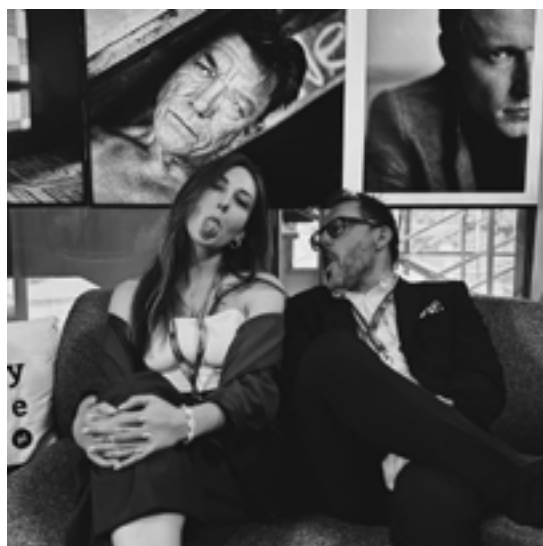
☛ Stworzenia gatunku ludzkiego rozciągające sobie twarz w celach poprawienia umiejętności z uwagających - tereny współczesnej Polski