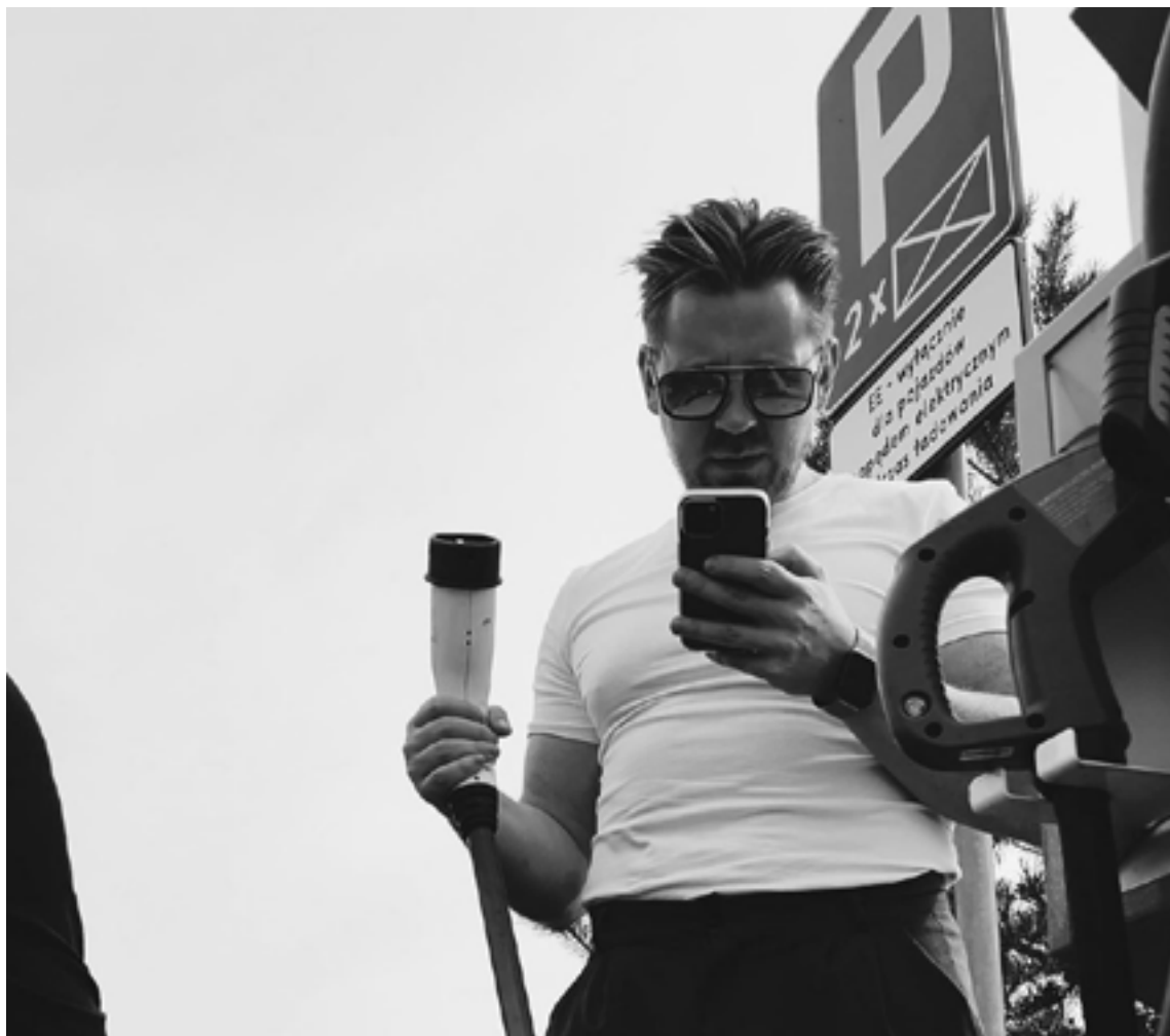
☛ Stojąc w polu, szukając prądu - akril na psim śwędzie

RELACJA REDAKTORA NACZELNEGO Z 49. FESTIWALU POLSKICH FILMÓW FABULARNYCH W GDYNI