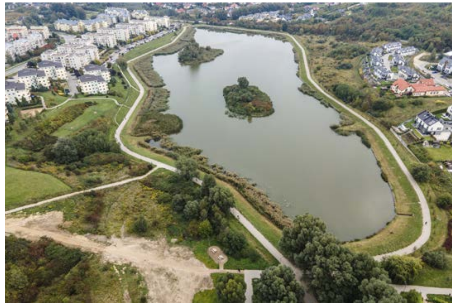
Przy okazji warto przypomnieć, że w Gdańsku powstaje Park Południowy – 77 hektarów terenów, które częściowo miały być zabudowane. W mieście jest obecnie 12 parków, ten będzie drugim co do wielkości.

Jednym z priorytetów Gdańska jest poszerzenie terenów zielonych. Między innymi z uwagi na fakt, że mieszkańcy coraz bardziej doceniają znaczenie tego typu przestrzeni w miastach. Warto również pamiętać, że ochrona zespołów przyrodniczo-krajobrazowych oraz użytków ekologicznych odgrywa kluczową rolę w ochronie przyrody, a jednocześnie wzbogaca ofertę turystyczną Gdańska. Ze względu na ich wartość naukową i edukacyjną, zrównoważony rozwój miasta kładzie duży nacisk na dbanie o te obszary oraz lokalne biocenozy.