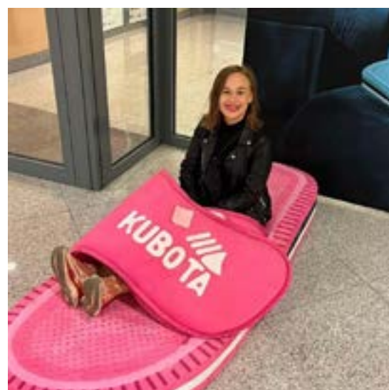
☛ Kobieta zamknięta w kapitalizmie - olej na włosach

Zapraszamy na przyszły rok, jubileuszowe wydanie, w ramach którego transgresje naniesiemy bezpośrednio na rzeczywistość i będziemy mówić tylko o rzeczach nieważnych. Przynajmniej - być może.