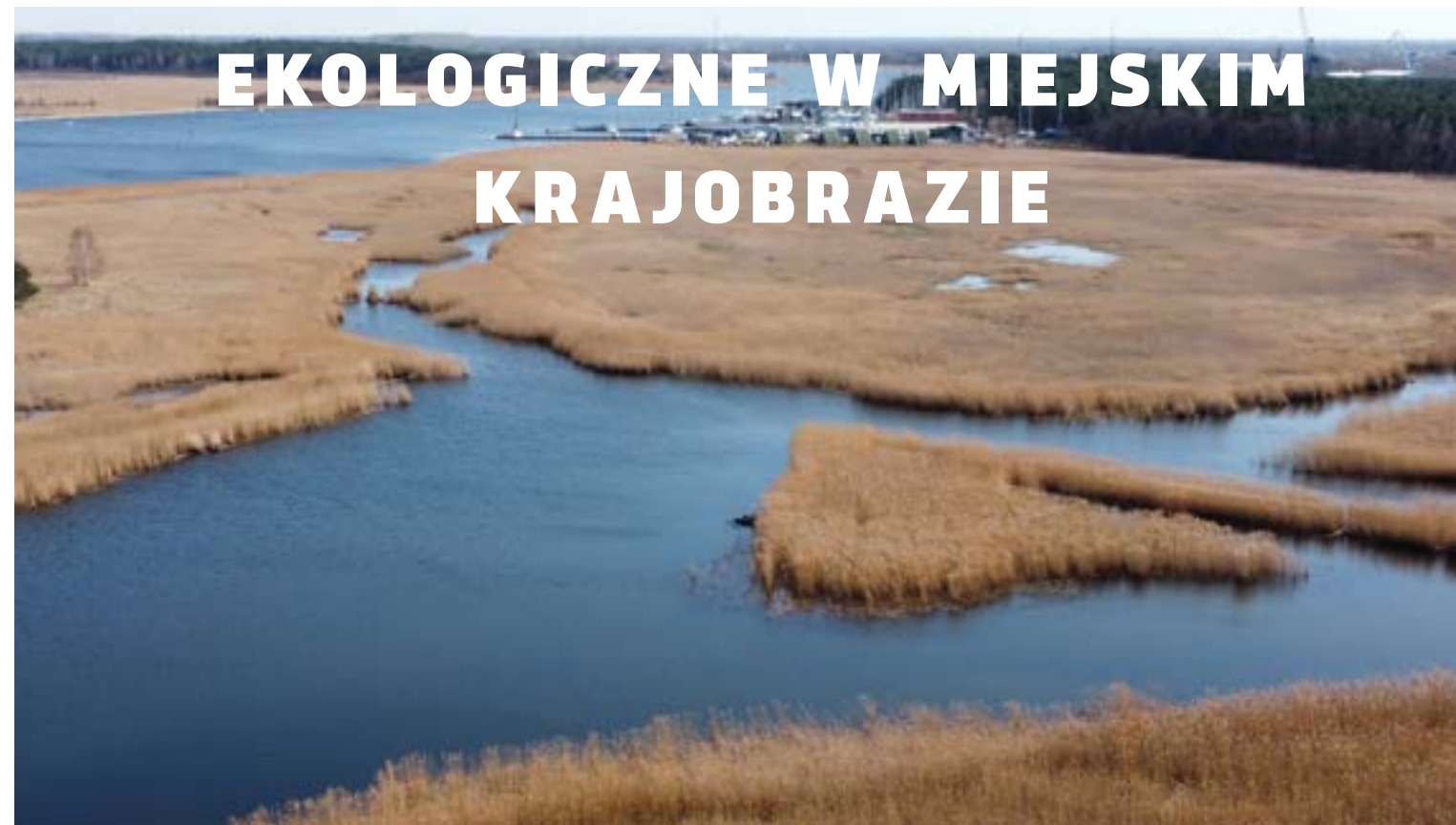
Wydma w Górkach Zachodnich to użytkek o powierzchni blisko dwóch hektarów na terenie tzw. Wyspy Stogi w Gdańsku.

GDAŃSK. MIASTO BOGATEGO DZIEDZICTWA KULTUROWEGO SKRYWA JESZCZE JEDNO OBLICZE – BOGATEJ PRZYRODY, KTÓRĄ ZDECYDOWANIE WARTO ODKRYĆ. MIMO, ŻE MIASTO KOJARZY SIĘ NAM GŁÓWNIEM Z PIĘKNYMI ZABYTKAMI I HISTORIĄ, W JEGO GRANICACH ZNAJDUJE SIĘ RÓWNIEM WIELE UŻYTKÓW EKOLOGICZNYCH. KTÓRE ZACHWYCAJĄ RÓŻNORODNOŚCIĄ FLORY I FAUNY. TO IDEALNE MIEJSCA NA ODPOCZYNEK I BLISKIE SPOTKANIE Z NATURĄ.