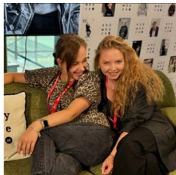
☛ Dwie samice gatunku ludzkiego maskujące się w rozentuzjzmowanym tłumie branding - jakieś dwa miesiące temu