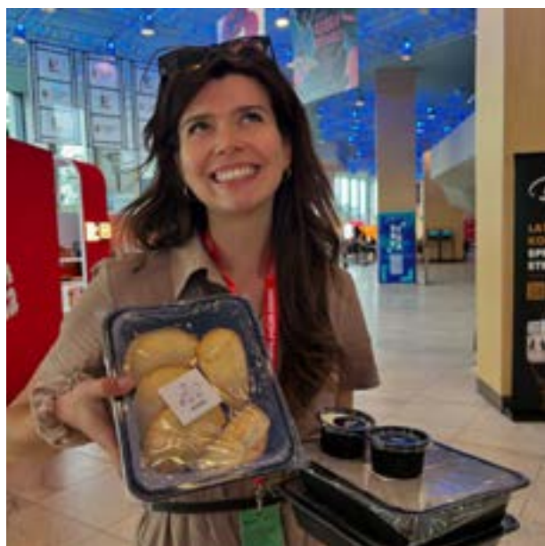
☛ Lokalna kobieta z tradycyjnym jedzeniem dla rdziennej ludności Polfruki - zdjęcie wykonane inteligentną suszarką ubrań